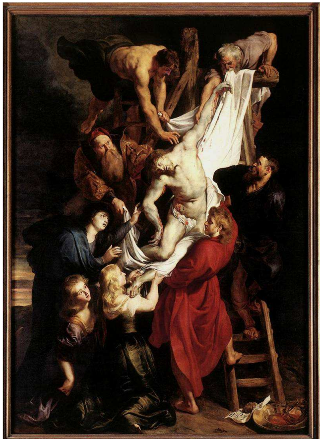
IMATGE 1 / IMAGEN 1

El davallament. Catedral d'Anvers. 1612. Pedro Pablo Rubens.