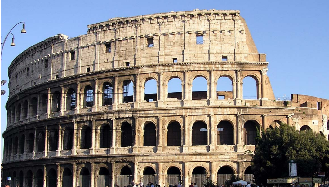
IMATGE 1 / IMAGEN 1