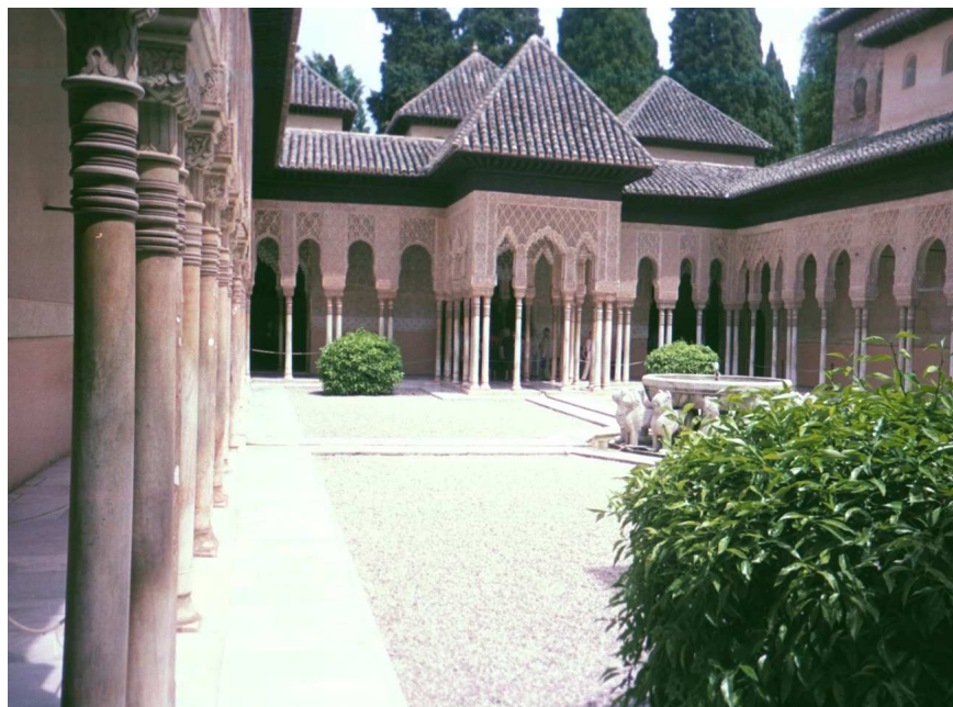
IMATGE 1 / IMAGEN 1

Pati dels Lleons de l'Alhambra ( Al Qalat Ahmra ) de Granada. 1354-1359. Patio de los Leones de la Alhambra ( Al Qalat Ahmra ) de Granada. 1354-1359.