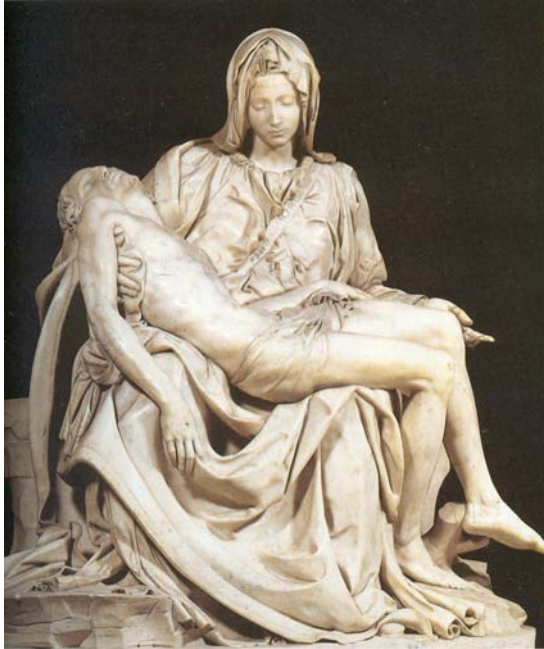
IMATGE 1 / IMAGEN 1

Pietà. Basílica de Sant Pere. 1499. Roma. Miquel Àngel.