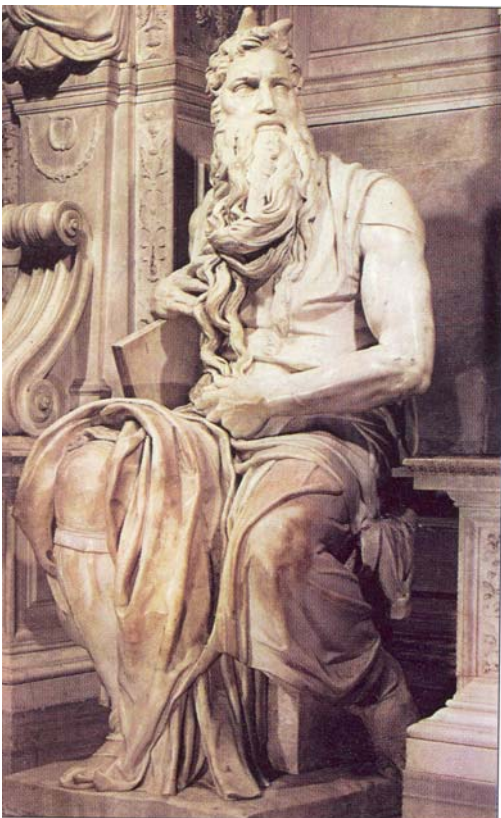
IMATGE 3 / IMAGEN 3

Moisés. Iglesia de San Pietro in Vincoli . 1515. Miguel Àngel.